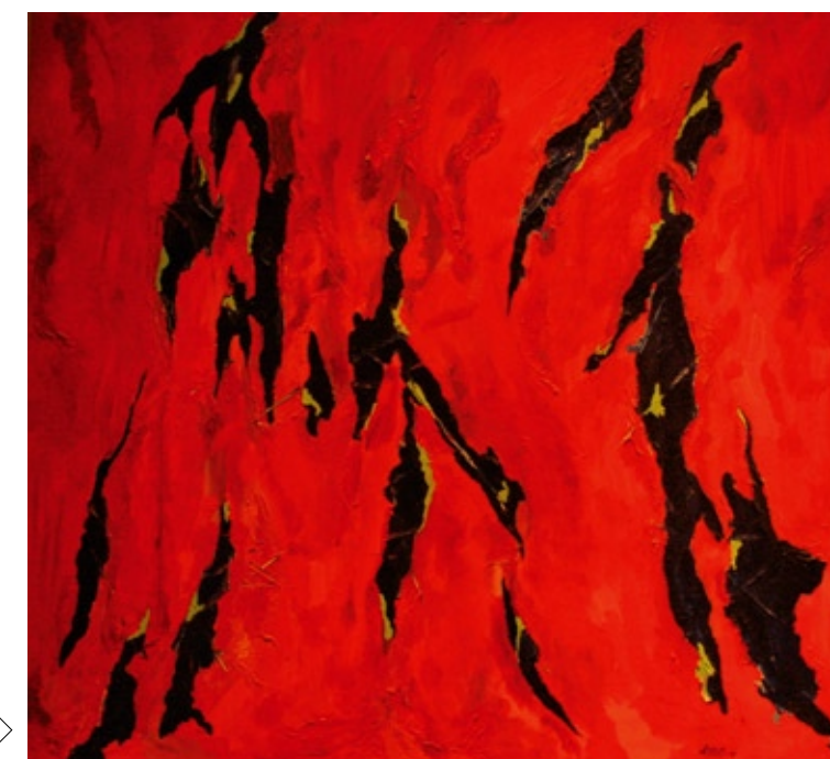
TANČĄCY W CZERWIENI